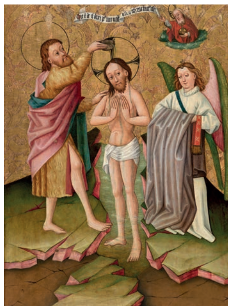
Maître de Rheinfelden, Le Baptême du Christ , technique mixte sur bois (épicéa)

Dans les années 1420, certaines personnalités émergent et les particularismes régionaux s'exacerbent. Le maître de Rheinfelden actif à Bâle vers 1450, Jost Haller à Strasbourg à la même époque ou Caspar Isenmann à Colmar vers 1460 réalisent des œuvres narratives avec un sens du détail et de l'expressivité. (Maître de Rheinfelden, Retable Lösel : Le Baptême du Christ , Dijon, Musée des Beaux-Arts et La Mort de la Vierge , Mulhouse, Musée des Beaux-Arts).