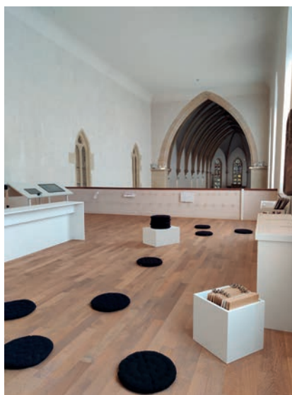
Espace de médiation, Musée Unterlinden