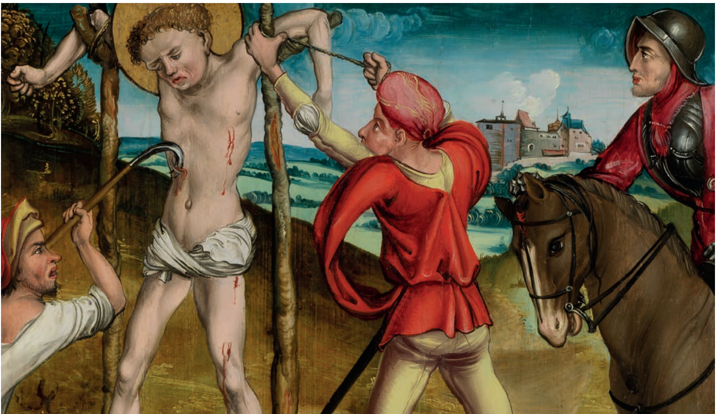
Lac de Constance (?) Le Martyre d'un saint , vers 1500, huile sur bois (épicéa)

Parcours permanent – Salle 6, chapelle & tribune