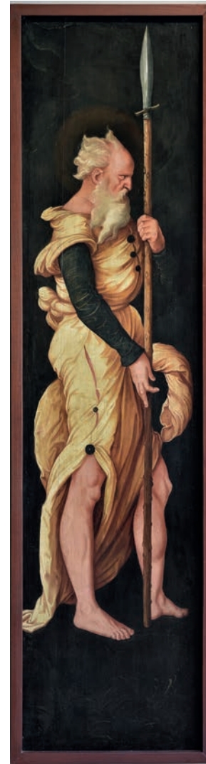
Hans Baldung Grien, Saint Thomas ?, vers 1528-1530, huile sur bois (tilleul)

Hans Baldung Grien se convertit au protestantisme en 1529 : les commandes religieuses se faisant rares à Strasbourg (devenue protestante dans les années 1520 et ayant ordonné le retrait des images des églises et couvents en 1530), il adapte sa production pour continuer à satisfaire et à développer sa clientèle : il se tourne vers les sujets profanes et les portraits tout en exécutant encore des tableaux de dévotion privée.