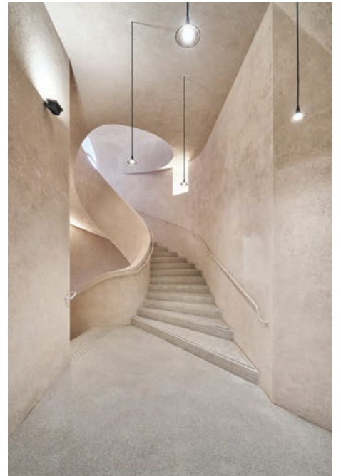
Vues du Musée Unterlinden : Ackerhof, Cloître et Escalier de l'Ackerhof

Le 3 avril 1853, le Musée Unterlinden ouvre officiellement ses portes. Outre la mosaïque du 3 e siècle découverte à Bergheim en 1848 et les plâtres antiques, il présente aux érudits locaux des œuvres d'art tels que le Retable d'Issenheim et le Retable des dominicains de Martin Schongauer issus du séquestre révolutionnaire.