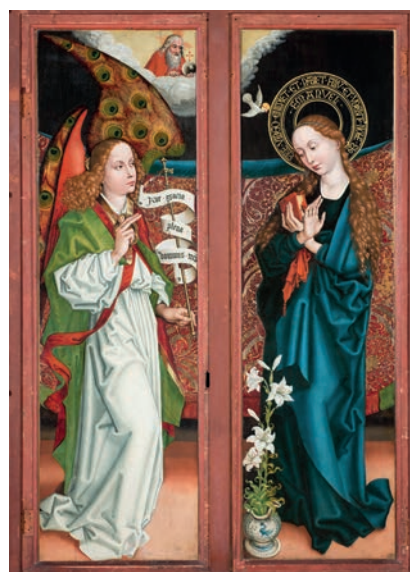
Martin Schongauer, Volets du Retable d'Orlier : Annonciation, 1475-1480, huile sur bois (tilleul)

Par cette stratégie de changement dans la continuité, il séduit des commanditaires locaux importants. Il exerce aussi une large et longue influence sur de nombreux artistes (peintres, graveurs, sculpteurs) dans la région du Rhin supérieur. Mais cette influence s'exerce bien au-delà du territoire grâce à la diffusion de ses nombreuses gravures, d'une qualité exceptionnelle, dans l'Europe entière, grâce à l'imprimerie alors en plein essor.