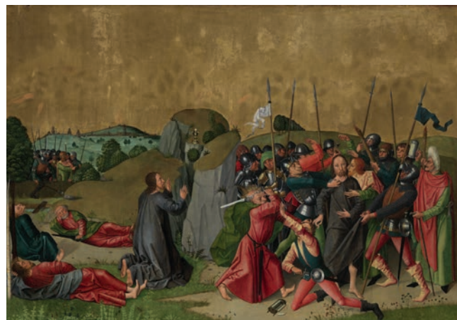
Caspar Isenmann, Volets du retable de la Passion , 1465, huile et tempera sur bois (épicéa) © Musée Unterlinden, Colmar. Photo : Le Réverbère / Mulhouse

À partir des années 1400, on assiste à l'apparition de plus en plus fréquente des commanditaires sur les œuvres qu'ils font réaliser pour des institutions religieuses, sous la forme de portraits et d'armoiries. Il leur importe d'être associé·e·s individuellement à leur donation afin d'en recevoir personnellement les bénéfices, spirituels (faveur divine), sociaux (supplément de prestige), ou mémoriels.