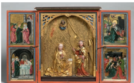
Anonyme, Reetable de la Vie de la Vierge, (retable domestique), vers 1480-1490, huile sur bois (volets), bois de résineux doré (caisse centrale) et bois de tilleul polychromé et doré (sculptures)