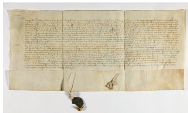
Contrat conclu entre les administrateurs de la fabrique de la collégiale Saint-Martin de Colmar et le peintre Caspar Isenmann, 1462

À l'inverse, le commanditaire précise parfois avec beaucoup de détails ses volontés, la qualité souhaitée, l'iconographie, et peut même exiger un dessin préparatoire qu'il doit valider avant l'exécution de l'œuvre. Le contrat de commande du Retable de la Passion du Christ de Caspar Isenmann est l'un des rares contrats de commande conservés dans la région du Rhin supérieur à la fin du Moyen Âge.