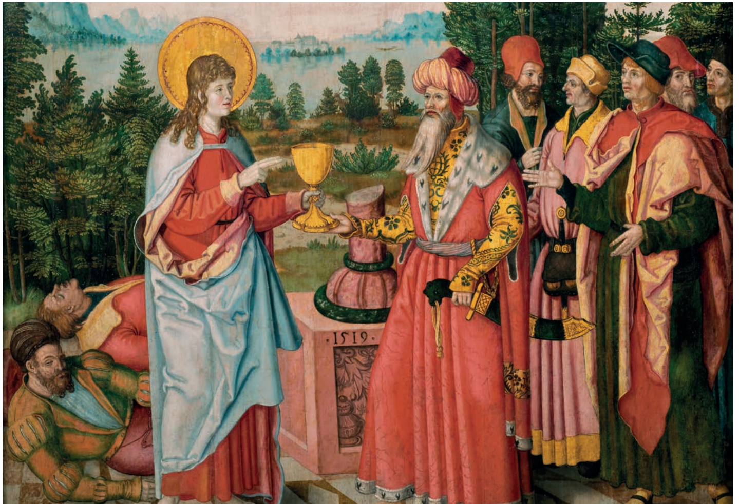
Wilhelm Stetter, Saint Jean buvant la coupe de poison , 1519, huile sur bois (tilleul)

La dernière section de l'exposition présente les œuvres de Wilhelm Stetter (vers 1487-1552) conservées dans les collections publiques françaises (musée de l'Œuvre Notre-Dame à Strasbourg, musée des Beaux-Arts de Nancy, Musée Unterlinden).