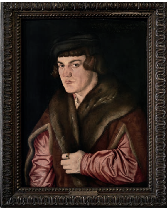
Hans Baldung Grien, Portrait d'un homme d'environ 25 ans , 1545, huile sur bois (tilleul) © Musée de l'Œuvre de Notre Dame, Strasbourg. Photo: Musées de Strasbourg

Qu'il peigne des sujets religieux comme Saint Thomas ou encore le Purgatoire (Musée de l'Œuvre Notre-Dame, Strasbourg) ou qu'il portraiture ses contemporains ( Tête de vieillard barbu , Musée des Beaux-Arts et d'Archéologie, Besançon et Portrait d'un homme d'environ 25 ans , Musée de l'Œuvre Notre-Dame, Strasbourg), Hans Baldung Grien invente des images novatrices dont la fougue non dénuée de violence fait écho aux angoisses de son temps.