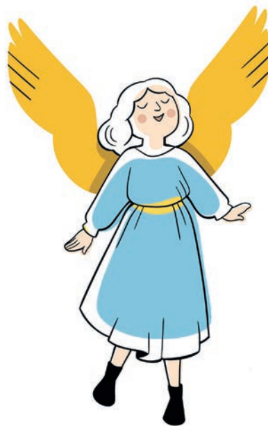
Mascotte du parcours famille © Musée Unterlinden, Colmar. Illustration : Anna Griot

Ce niveau propose une appréhension des œuvres sous une approche pédagogique et ludique. Les visiteurs observent l'œuvre pour repérer un ou plusieurs éléments particuliers, leur attention est attirée sur des détails pittoresques dont fourmillent souvent les œuvres de la fin du Moyen Âge. Ce parcours comprend également plusieurs dispositifs, pour une nouvelle lecture des œuvres.