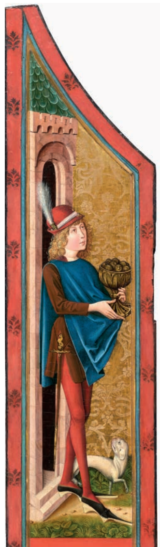
Fribourg-en-Brigau, Scènes de la vie de sainte Agnès (revers, détail), vers 1490-1500, huile sur bois