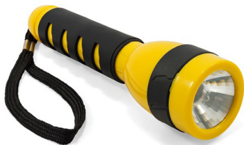
Une source lumineuse...