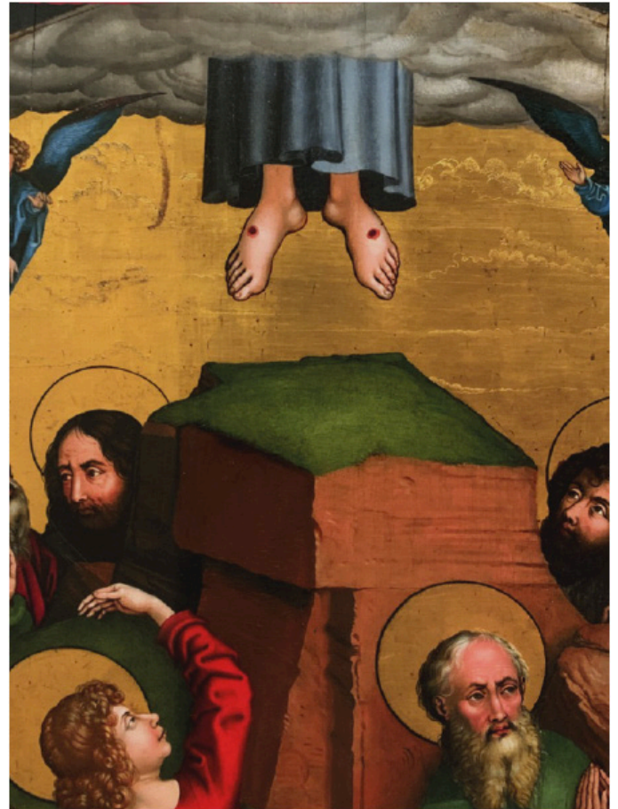
Martin Schongauer, Retable des Dominicains : Enfance et Passion du Christ « Ascension » , vers 1480 (détail)

Le but principal est de mettre en valeur les pièces exposées grâce à un travail scénographique et de raconter un propos.