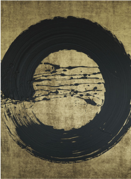
Fabienne Verdier Ascèse , 2012

Observe à présent ces deux œuvres qui dialoguent au sein des collections du musée.