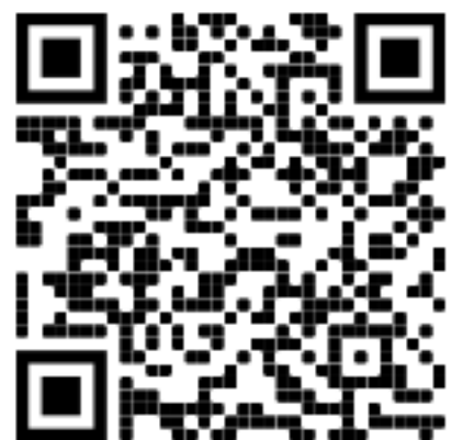
Accès à la vidéo