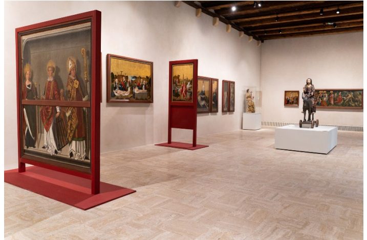
Vue de la salle 2, Production artistique des années 1420-1470, Musée Unterlinden, Colmar