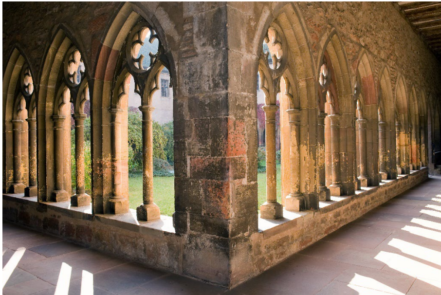
Vue du cloître, Musée Unterlinden

À l'occasion des festivités autour de la fin de la restauration du Retable d'Issenheim