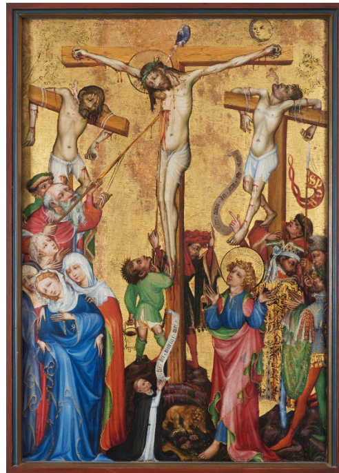
Hermann Schadeberg (actif entre 1399 et 1427), La Crucifixion au dominicain , Vers 1410 et 1415, Huile sur bois, 126 cm x 87 cmx. 1,7 cm, Musée Unterlinden, Colmar

Parmi les pièces emblématiques de cette section, on cite La Crucifixion au dominicain qui se trouvait dans la collégiale Saint-Martin de Colmar à la fin du 18 e siècle. Considérée comme le plus ancien témoignage de la peinture de chevalet dans la région du Rhin Supérieur, La Crucifixion peinte sur bois est caractéristique de ce début du 15 e siècle et du gothique international avec ses couleurs chatoyantes imitant l'éclat de l'orfèvrerie, son fond d'or aux motifs poinçonnés, la préciosité dans les détails proche de l'enluminure et l'allongement des proportions humaines. Autour du Christ mourant dont l'âme, sous la forme d'une petite silhouette, va être accueillie par Dieu, se trouvent les deux larrons. La vie quitte leurs corps et alors que l'âme du mauvais larron s'enfuit devant un diable, celle du bon larron attend d'être emportée par un ange. Le fond or céleste est orné de multiples anges recueillant le sang du Christ. Pour s'assurer de sa mort, Longin vient de percer de sa lance son flanc droit et Stephaton approche de ses lèvres l'éponge imbibée de vinaigre. Le groupe des femmes autour de la Vierge et celui des hommes encadrent la Crucifixion. Une exposition récente a permis d'attribuer cette peinture au peintre strasbourgeois Hermann Schadeberg, également auteur de modèles de vitraux.