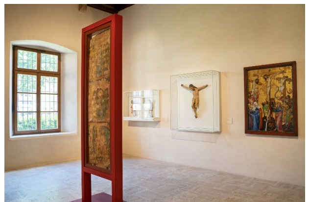
Vue de la salle 1, Production artistique des années 1380 – 1420, Musée Unterlinden, Colmar