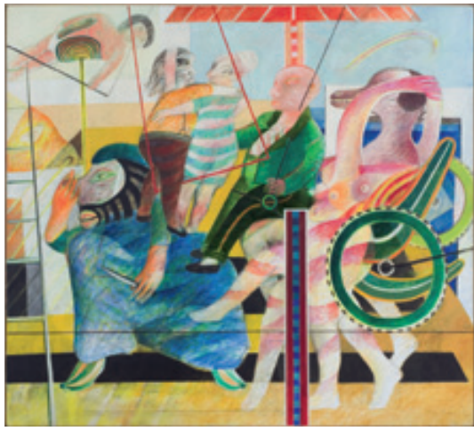
Martin Engelman, Le manège , 1967, huile sur toile, don Mme Régine Engelman