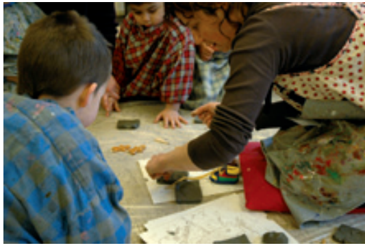
Atelier au musée Unterlinden, école des Pâquerettes, 2011