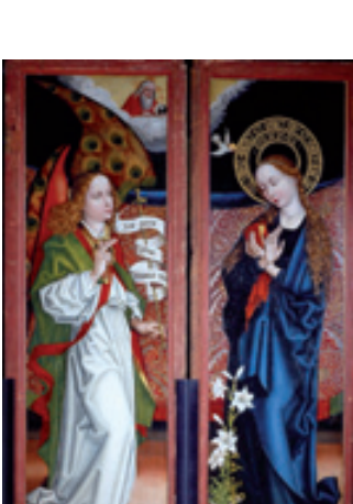
Martin Schongauer, L'Annonciation , retable d'Orlier, vers 1470, huile sur bois (sapin), musée Unterlinden, Colmar