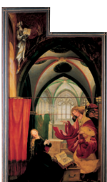
Grünewald, retable d'Issenheim, Annonciation , entre 1512 et 1516, huile sur bois (tilleul), musée Unterlinden, Colmar