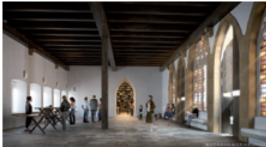
Vue du futur hall d'accueil du musée Unterlinden © Herzog &amp; de Meuron