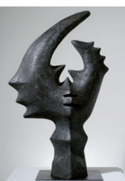
Simone Boisecq, Le Faune , 1956, ciment pierre, acquisition réalisée avec le soutien du Fonds Régional d'Acquisition pour les Musées (État/Conseil régional d'Alsace)

Visite guidée à la Bibliothèque municipale le jeudi 10 mai à 17h par Frédérique Goerig-Hergott Entrée libre dans la limite des places disponibles