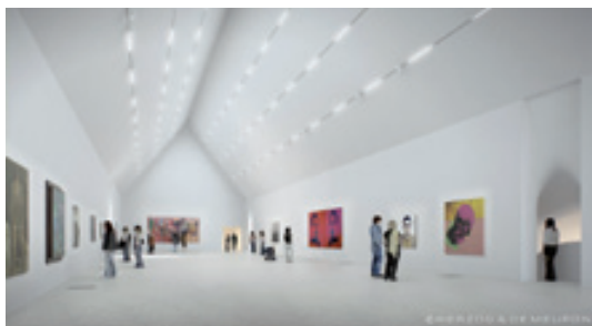
Vue de la future salle d'exposition temporaire dans l'aile nouvelle du musée Unterlinden © Herzog &amp; de Meuron