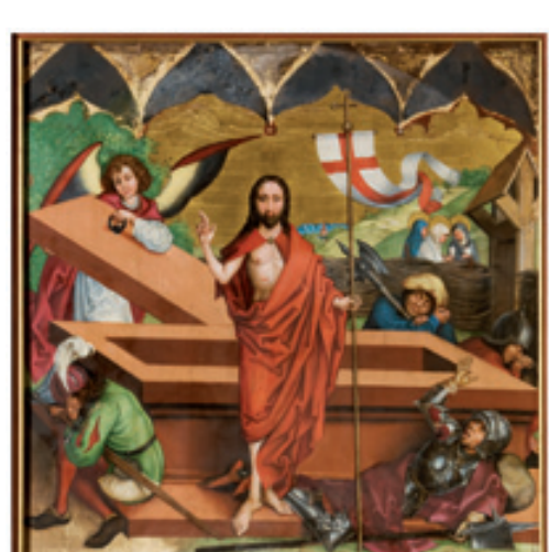
Martin Schongauer et après restauration, retable des Dominicains, Résurrection, 1470-1475, huile sur bois (sapin), musée Unterlinden, Colmar

Renseignements : Agence LK Tours - Tél. +33 (0)3 89 24 04 11