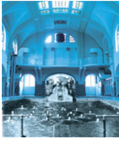
Illustration pour la couverture du livre : Le Temps des bains - Colmar , 2011

Membres de la Société Schongauer, Pass musées et Carte culture : 5 €