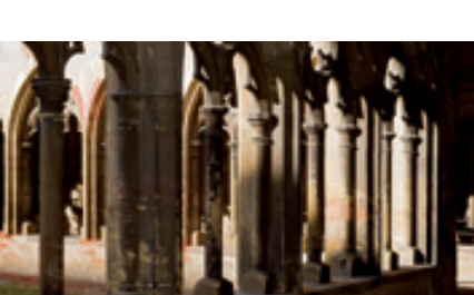
Vue du cloître, musée Unterlinden, Colmar

Horaires : 19h - 22h (dernière entrée à 21h45). La gratuité d'entrée est offerte à tous les visiteurs.