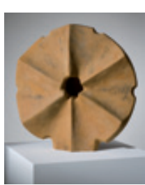
Simone Boisecq, Soleil , 1956, résine, don de l'artiste, musée Unterlinden, Colmar